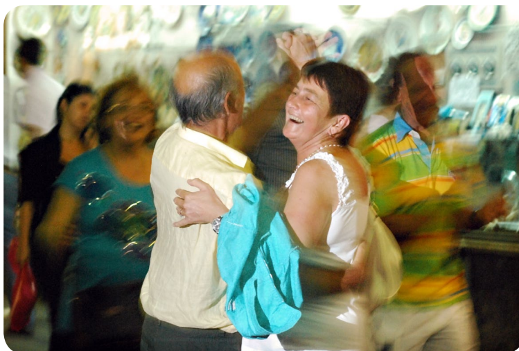
III - Whirlpool of life