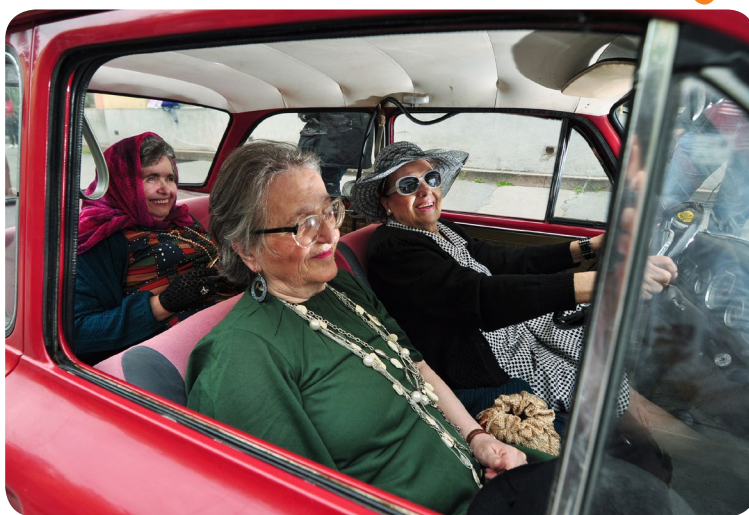
I - Going on a journey

Более подробная информация и фото http://zlatnodoba.webs.com